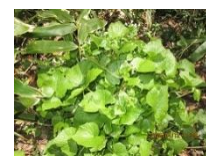
ワサビ:アナグマの森