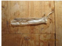
作業小屋物置にあった ヘビの抜け殻

<作業小屋前> 昨年の12月11日でメモリーオーバー(14.8GB)となり、ツグミと思われる野鳥とキツネの足跡だけだった。尚、個々の動画はトップ画面の”動画撮影記録”をクリック後、希望する場所を選択することにより見ることができます。以上