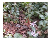
フッキソウとカタクリ :リスの森