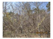
マンサク-水場近傍