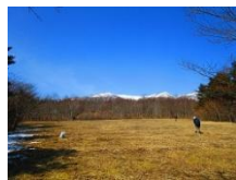
第2 駐車場から見た 南蔵王