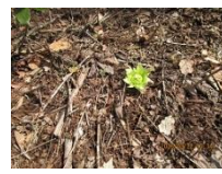
フキノトウ: 第2 駐車場 場