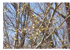
クマシデ:彩遊の森