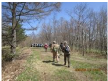
強風の中、樹木調査 へ向かう

ハクビシンの映像が 7 割を占めている。その他はタヌキ、イノシシでリスは木から降りてくる一瞬間なので気を付けていないと見逃す。(画面左下)